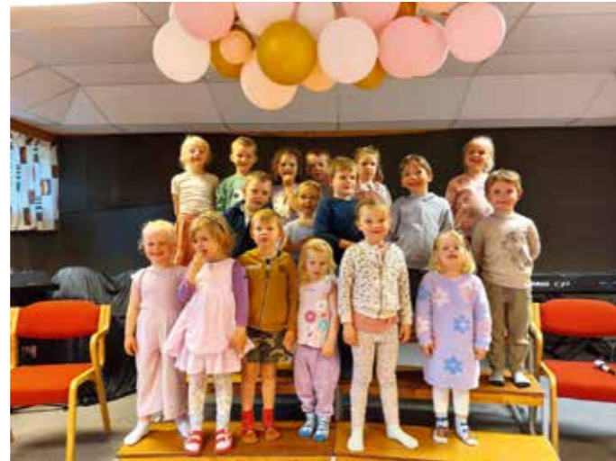
Hellemyr og Grim menigheter er helt avhengig av at folk gir gaver. Uten disse inntektene blir det vanskelig å opprettholde et godt tilbud til barn, unge og voksne. På bildet ser vi knottekoret i Hellemyr menighet.

KONTAKT: tlf. 38 17 41 14 • e-post: ht@hotel-norge.no