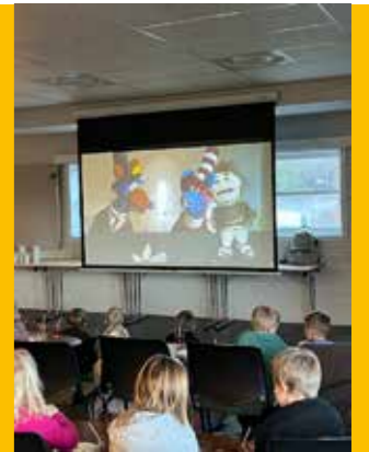
Barna koste seg på kino i kirka.

Kvelden ble avsluttet med å tegne og fargelegge litt fra det de hadde hørt om i filmen. Og mon tro om ikke det var 26 småunger på Hellemyr som hadde med seg en liten koserotte i senga den kvelden.