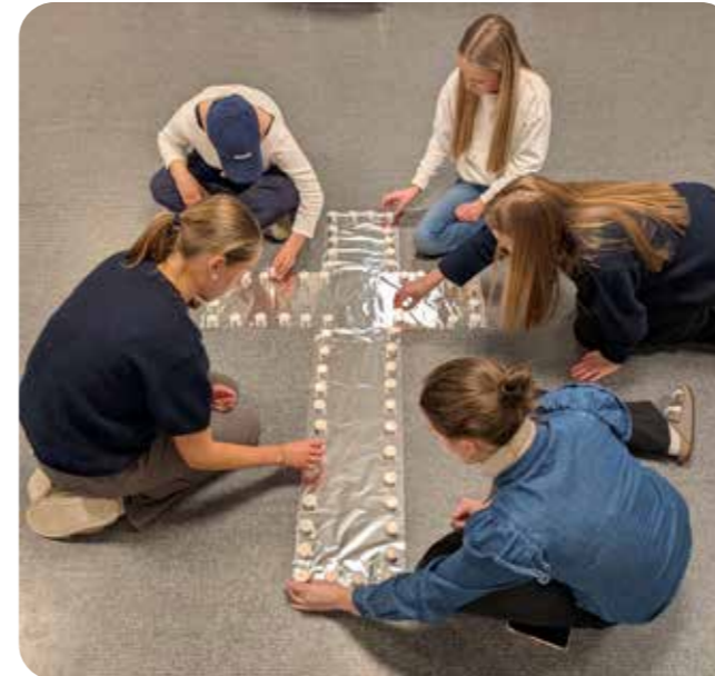
Hellemyrkonfirmantene var i mars på overnattingstur til Evjetun leirsted. Her er de avbildet på en korssamling.