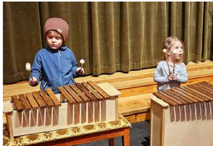
Givertjeneste er en viktig inntektskilde for både Grim og Hellemyr menigheter. Dette bildet er tatt på småbarnssang i Grim kirke. Annenhver tirsdag (i oddetallsuker) er det småbarnssang etter tirsdagsmiddagen.