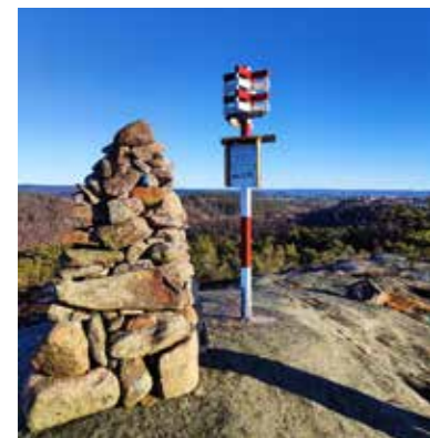
Fin utsikt på toppen av Øyliheia.