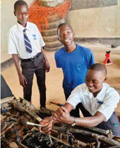
Flyktningeleieren Kiryandongo Refugee Settlement ligger 3–4 timers kjøretur nord for hovedstaden Kampala. Her ser vi noen elever på bilmekanikernlinjen.