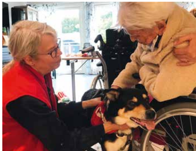
Mange ønsker å klappe Sika. Den 13 år gamle besøksunden er en blanding mellom Border Collie og Retriever.