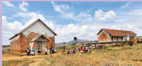
Glimt fra Mangarano

Dette arbeidet vil vi i Grim menighet støtte den tiden vi har igjen av gjeldende misjonsavtale. Har du lyst til å bidra? Det kan du gjøre ved å vipse en gave til NMS sitt arbeid på Madagaskar. Benytt vippsnummer 117473