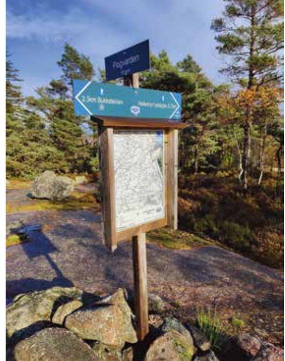
Hadde det ikke vært for alle trærne, kunne man sett langt i alle retninger fra Flogvarden.

Benevnelsen Flogvarden har sammenheng med at det derfra ble benyttet flagg som kommunikasjon og varsling om farer. Dette ble faktisk benyttet under Napoleonskrigen. På 45 minutter kunne man via vardene sende en melding fra Kristiansand til Christiania (Oslo). På den tiden var det nok en del færre trær på toppen av Flogvarden.