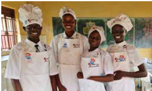
Den videregående skolen i flyktningleiren i Kiryandongo satser på yrkesfaglige retninger. Her ser vi noen elever som studerer matlaging og restaurantdrift.